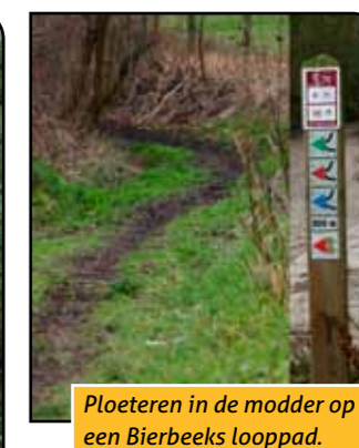
Ploeteren in de modder op een Bierbeeks looppad.

Verantwoordelijke uitgever: Jan De Bouw Pimberg 101, 3360 Bierbeek