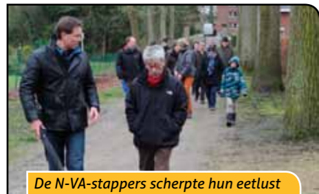
De N-VA-stappers scherpte hun eetlust aan door deze stevige wandeling.

Om 15u30 startten we met een verfrissende wandeling door de