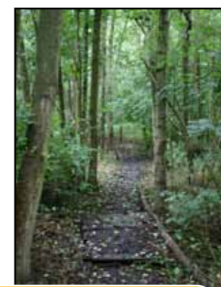
Het Bouvarreke een paar maand geleden, nu is er bijna geen doorkomen aan.

Een mens zou zowaar heimwee krijgen naar het verkiezings- jaar 2012!