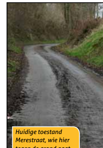
Huidige toestand Merestraat, wie hier tegen de grond gaat...

N-VA Bierbeek zette vorig jaar een actie op touw rond de herwaardering van de trage wegen en de volwaardige integratie ervan binnen onze gemeentelijke infrastructuur, alsook een actie rond verkeersveiligheid, met de klemtoon op de veiligheid van de zwakke weggebruikers en in het bijzonder de schoolgaande jeugd.