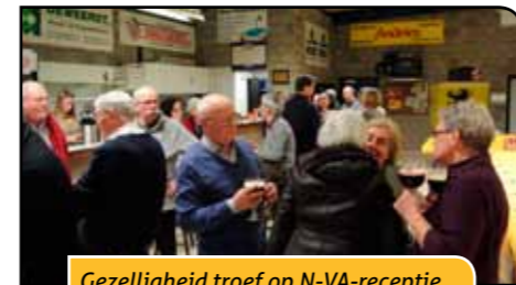
Gezelligheid troef op N-VA-receptie.

nodige kritische vragen aan onze mandatarissen gesteld.