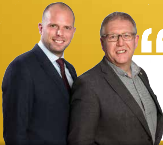
Theo Francken Staatssecretaris Lijstduwer

Een slankere provincie, die efficiënt wordt beheerd en meer ondersteuning biedt aan de gemeenten: daar zet ik me voor in.