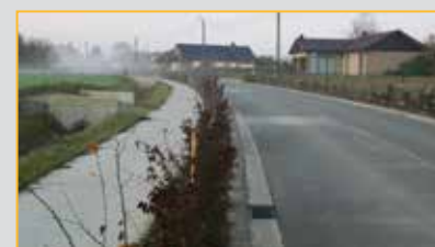
Waversesteenweg in een nieuw kleedje

Foto's zeggen meer dan woorden, onze fietsactie van deze zomer heeft resultaten opgeleverd.