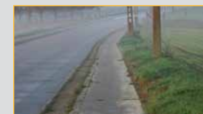
Neervelpsestraat met terug berijdbare fietspaden