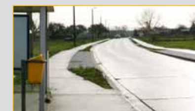
Nieuwe fietspaden langs de Lovenjosestraat. Nu nog beplanting