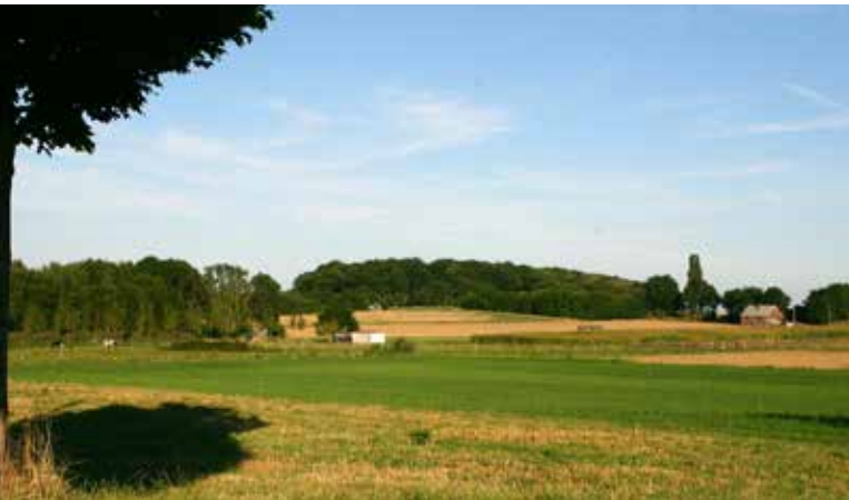
▲ De Galgenberg op de Bremt, een typisch landbouwgebied in Bierbeek

Ecorealisme is een pleidooi voor een vermindering van de administratieve lasten en voor meer kansen voor Landbouwers. De N-VA Bierbeek wil ondernemerschap stimuleren en kansen bieden aan iedereen die voor zichzelf een betere toekomst wil uitbouwen. Daarom roepen wij de meerderheid op om landbouwers volop te steunen.