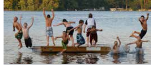
Kansen voor kansarme jongeren p. 3