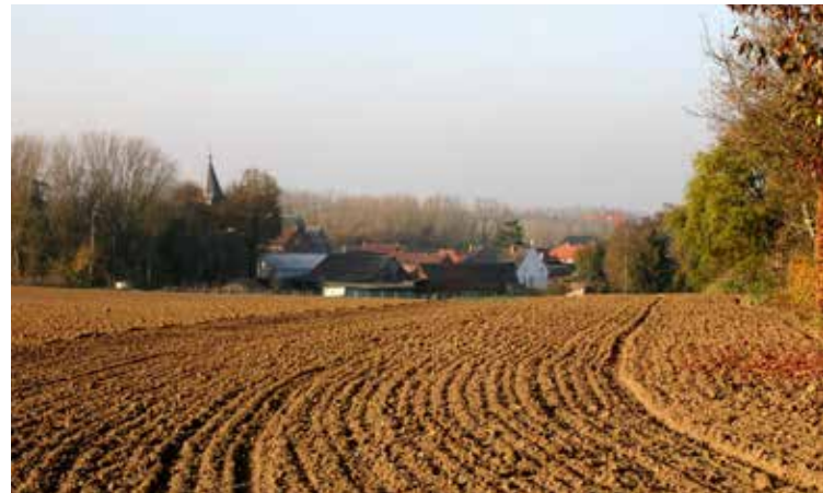
▲ Mevrouwkensveld; betaalbaar wonen een noodzaak in Bierbeek

De Bierbeekse bestuursploeg is halfweg. Als wijze van tussenevaluatie organiseerde het gemeentebestuur de afgelopen weken in elke deelgemeente een dorpsvergadering om een luisterend oor te leggen bij haar inwoners. Een lovenswaardig initiatief dat N-VA Bierbeek toejuicht. Elk initiatief waarbij burgers gehoord worden en betrokken worden bij het beleid dat ons allen aanbelangt, verdient een kans.