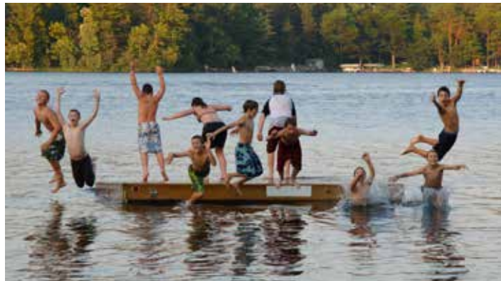
Ook kansarme jongeren verdienen alle kansen. ▲

Enkel op deze manier werk je aan een echte inclusieve gemeenschap en geef je de jongeren de kansen die ze verdienen. De N-VA werkt daar graag aan mee.