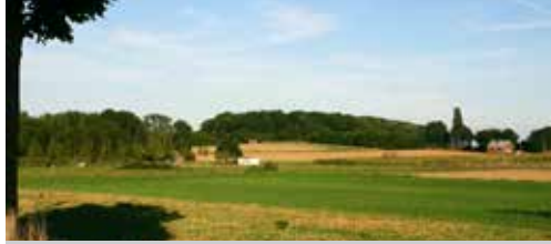
Ecorealisme in Bierbeek p. 2